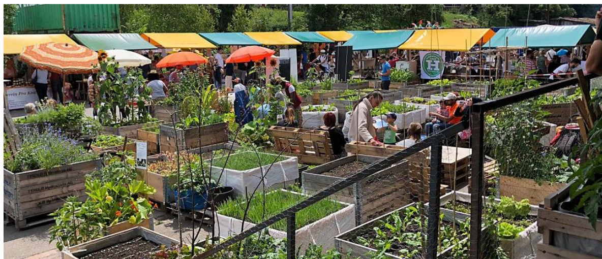
Gartenprojekt auf dem Lattich-Areal

( https://www.densipedia.ch/st-gallen-zwischennutzung-lattich-belebt-bahnhofsareal , 31.05.2021)